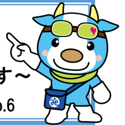
社協の「きょうちゃん」